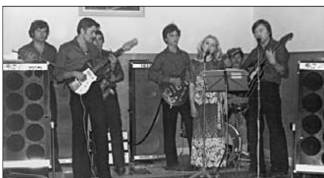
Mníchova Lehota (Radar) 1978