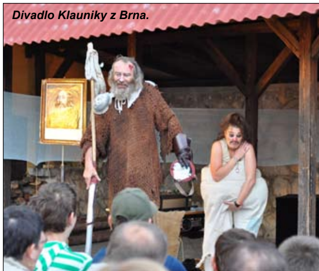
Divadlo Klauniky z Brna.